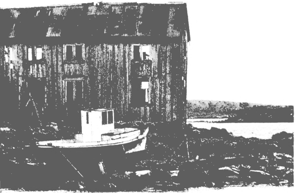
Hva flytter de fra?