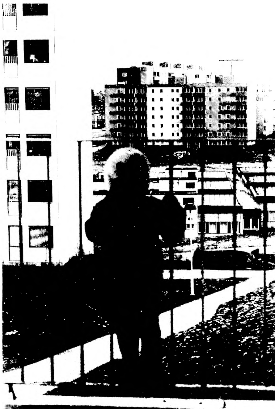
Hva flytter de til?