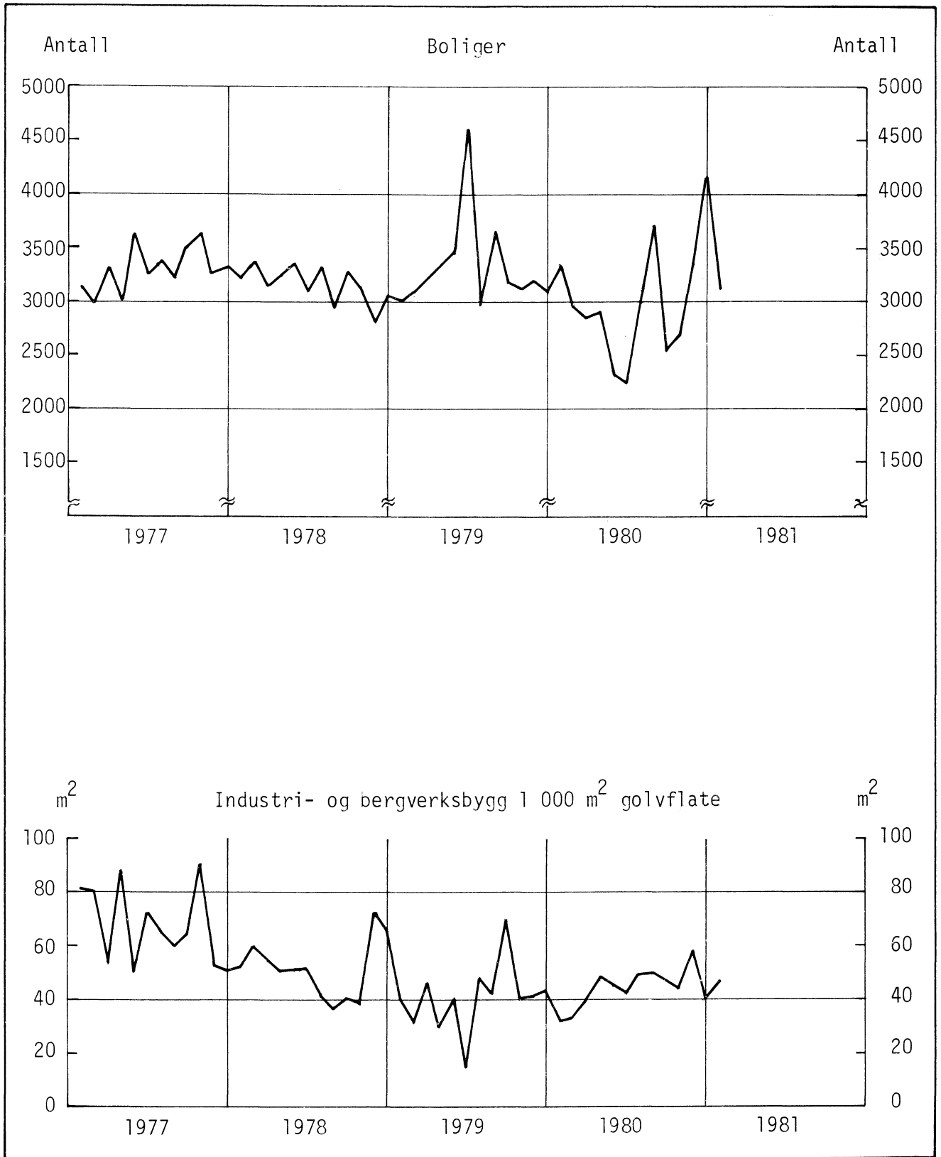
Bygg satt i gang. Sesongkorrigert