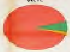
Stamøyra og Stjørdal 38 174