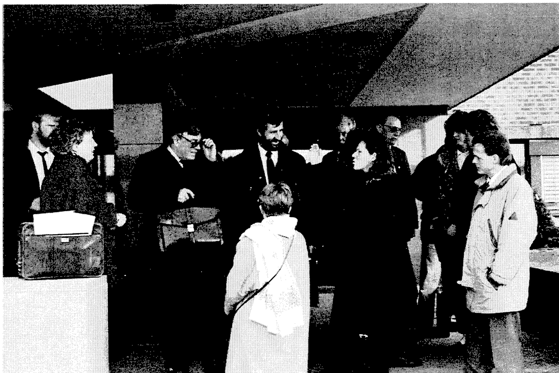
Administrasjonskomiteen i Stortinget besøkte SSB Kongsvinger også i 1990.

Sentrale punkter fra utredningen ble gjentatt. Ingen gjennomgripende behandling av organisasjonsforholdene i SSB ble sett på som nødvendig, men bare slike drøftinger som var betinget av den geografiske splittingen. Notatet tok opp den sterke motstanden som spesialisering og sentralisering av funksjoner hadde møtt. Som svar på denne ble det sagt at for å kunne prioritere og