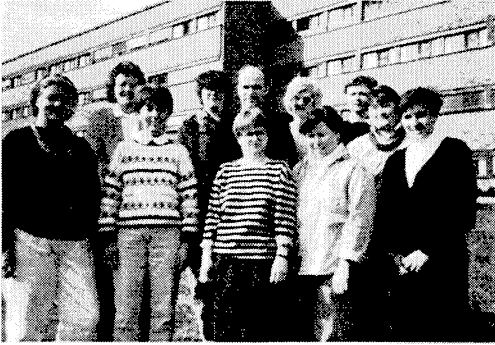
Byråskolen startet virksomheten i Kongsvinger først på 1970-tallet. Her et kull fra 1991.