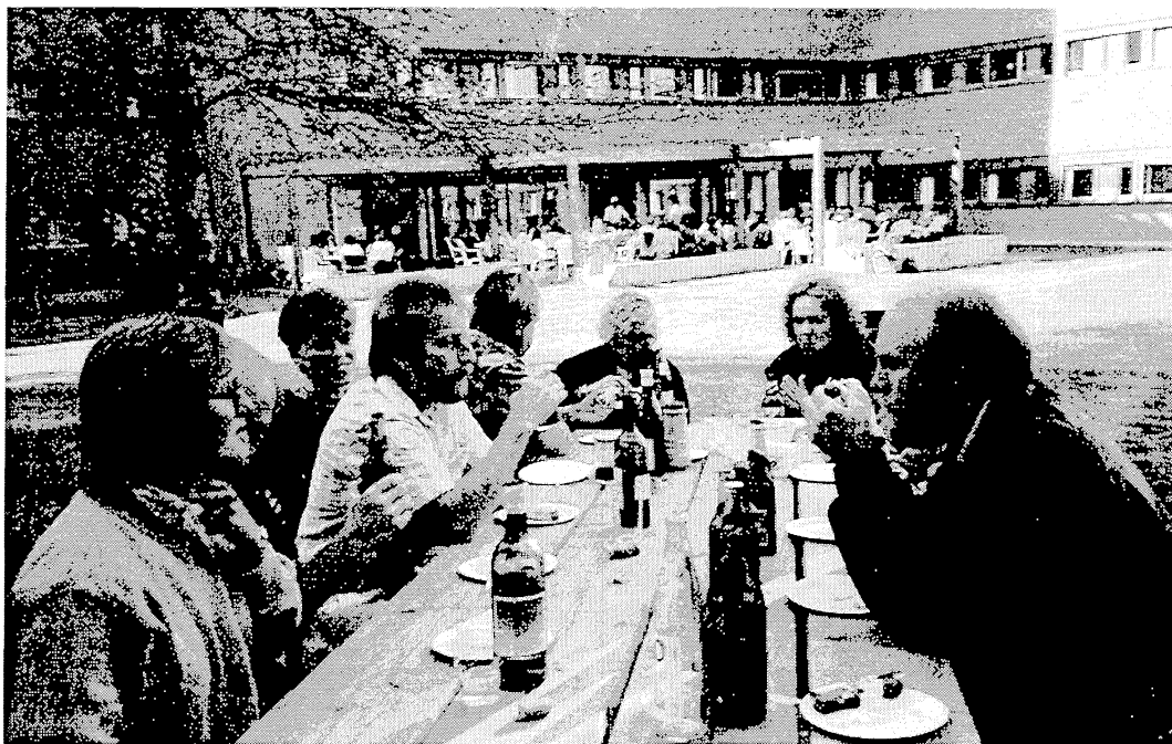
Bygget har landlige omgivelser. Her fra en grillfest.