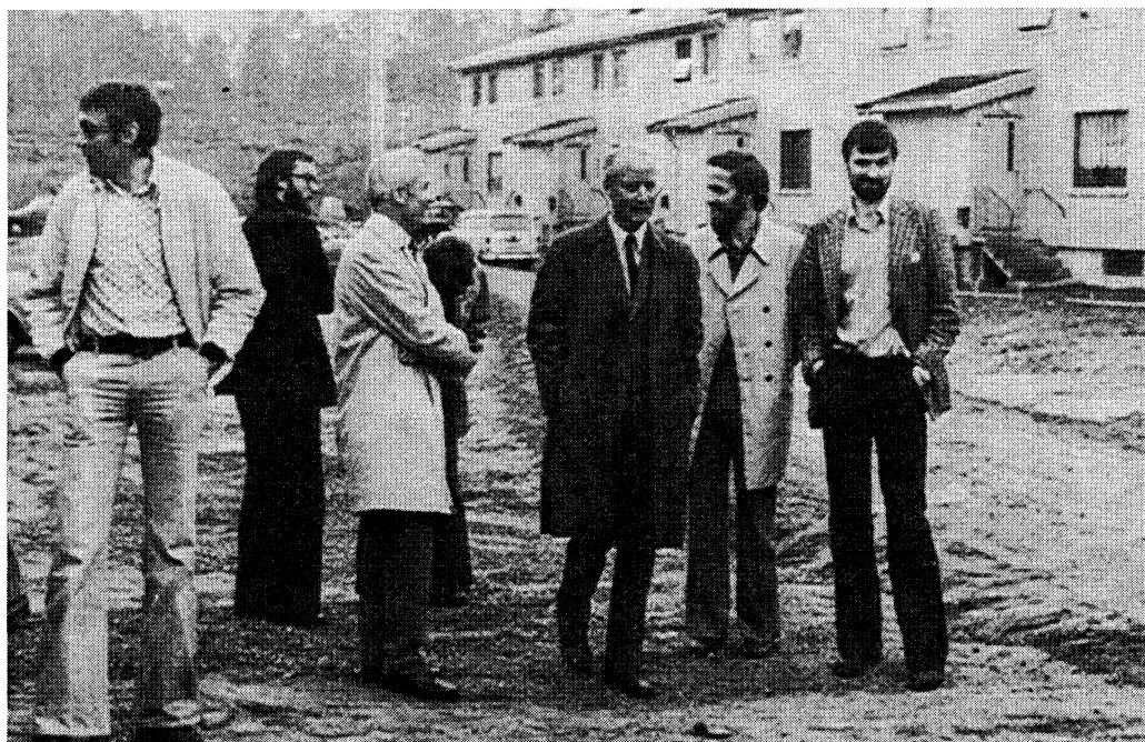
SSB-medarbeidere på besøk i et nybyggerfelt i Kongsvinger i 1975

Vangen og Roverud besøkt. På det siste orienteringsmøtet ble det opplyst at et entreprenørfirma samme høsten skulle gå i gang med bygging av 11 eneboliger i Lia (12-15 minutters gange fra der SSB holdt til) med Husbankfinansiering og toppfinansiering i byggeperioden i Vinger Sparebank. Igjen var det snakk om et prisnivå langt lavere enn i Oslo-området. Kalkylen lød på 240 000 kroner pr. hus på 800 m 2 selveiertomt. Entreprenøren ble kontaktet der og da, og ble gitt forståelsen av at prosjektet kunne være av stor interesse for SSB-medarbeidere. Både skriftlig og telefonisk forbindelse med entreprenøren i dagene etterpå førte til en foreløpig opsjon på et visst antall av husene. Denne opsjonen ble det gjort bruk av. I sin tid flyttet i alt 6 medarbeidere fra Oslo sammen med sine familier inn i nybygde hus i Lia. Noen av medarbeiderne fra samme utflyttingsperiode kjøpte seg likevel nybygde hus i andre boligområder.